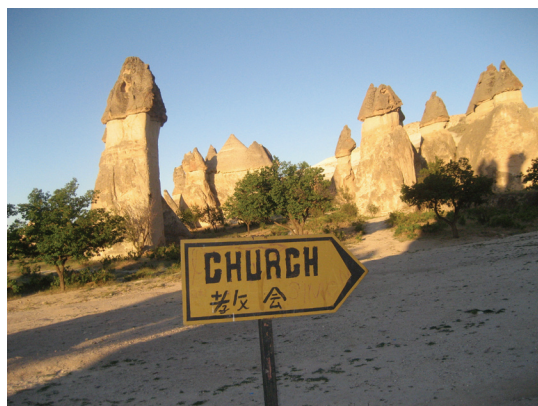
In Cappadocia, Turkey St. Peter & St. Paul 聖伯多祿及聖保祿傳教處