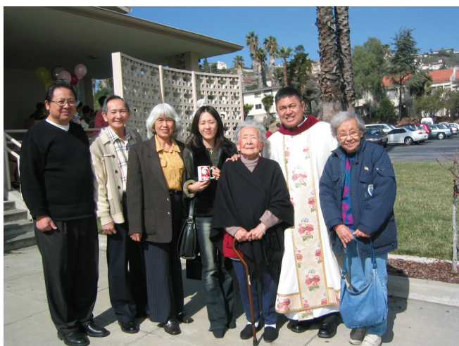
呂神父蔣家沈家與聖地牙哥教友