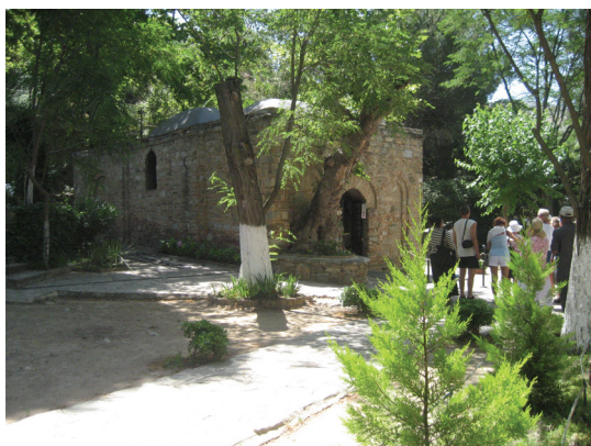
In Turkey The House of Virgin Mary 土耳其境內聖母的居屋

土耳其之旅給我們帶來新的喜訊，只要人相信，天主是永遠站在我們身邊的。我們要負起福傳的責任，向世人講述主的奧蹟。