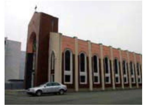
北韓唯一的天主教堂 平壤獎忠堂外景