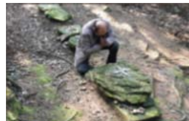
堆積的石頭下是切之丹在山頂上的墳墓，上面以小石頭排成的十字架，在祈禱完畢後即可毀去踪跡。