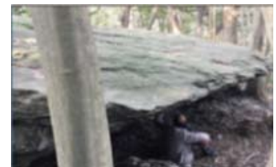
切支丹在遠離塵囂的山頂上，大聲背誦學習祈禱的巨岩。