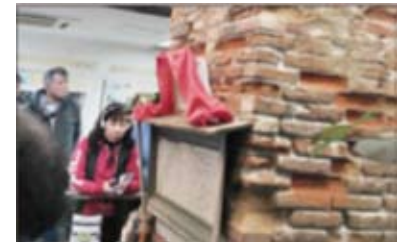
聖國柏(St. M. Kolbe)在日本時使用過的紅磚暖爐，也是聖母騎士發源地。