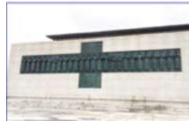
長崎西坂公園二十六位殉道聖人的紀念碑

信仰原來是一種與我們血肉、精神融和、深刻在我們靈魂內、生活在我們氣息內的東西。信仰是揉入在人的實體和靈性內、不可分割的一部分。它是我們明確地知道自己從哪裡來，將往哪裡去，以及為什麼生活的認知。 (中半島華人團體 教友通訊第217期)